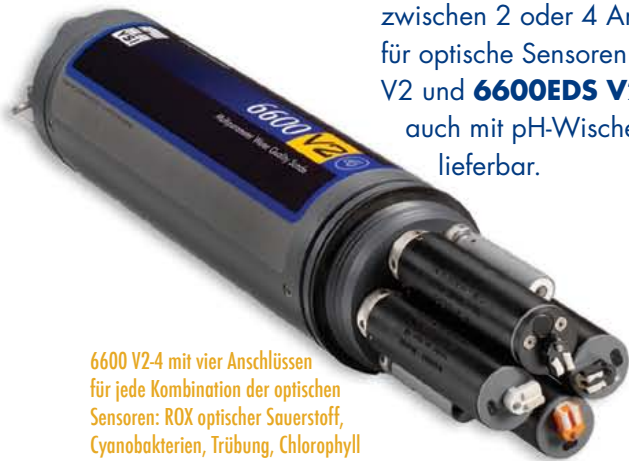
6600 V2-4 mit vier Anschlüssen für jede Kombination der optischen Sensoren: ROX optischer Sauerstoff, Cyanobakterien, Trübung, Chlorophyll oder Rhodamin.

6600 V2 Sonde hat die maximale Sensorausstattung sowie längste Batterie-Standzeiten. Wählen Sie zwischen 2 oder 4 Anschlüssen für optische Sensoren. Die 6600 V2 und 6600EDS V2 sind auch mit pH-Wischer-System lieferbar.